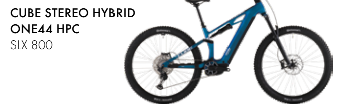
CUBE STEREO HYBRID ONE44 HPC SLX 800