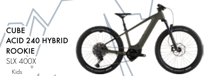
CUBE ACID 240 HYBRID ROOKIE SLX 400X Kids