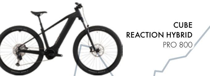
CUBE REACTION HYBRID PRO 800